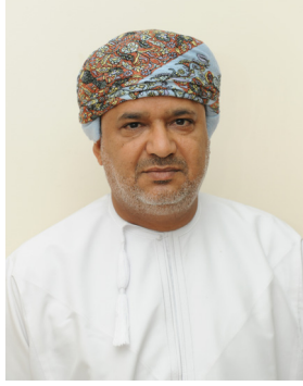
د. صالح بن منصور العزري مساعد الرئيس لشؤون الطلاب